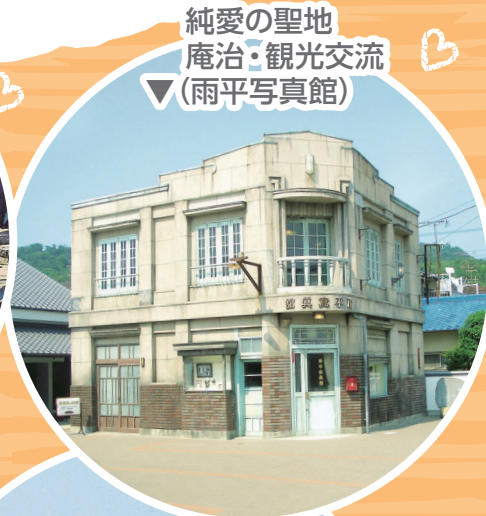
純愛の聖地 庵治・観光交流 ▼